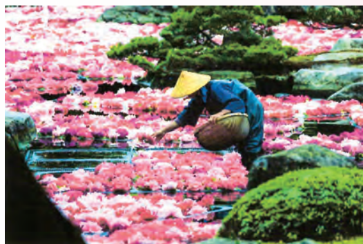
大根島由志園の春