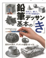
鉛筆デッサン基本の画材セット付コースもあり