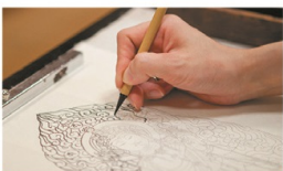
下絵図像集 用紙・筆などの画材付き

新・色えんぴつでアート 手軽な色鉛筆で自由に描きましょう。水彩画風の描き方も学べます。