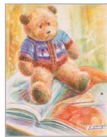
色鉛筆72色セットコースもあり

新・色えんぴつでアート 手軽な色鉛筆で自由に描きましょう。水彩画風の描き方も学べます。